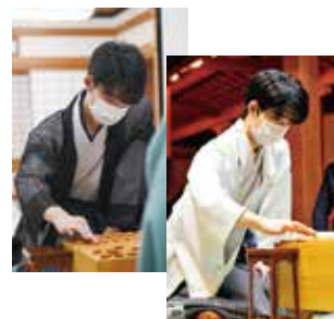
「時の人 藤井聡太 九段」