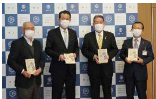
R3. 3. 26 瀬戸市役所