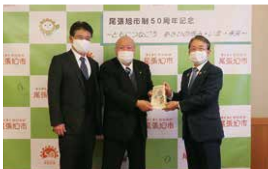
R3. 3. 11 尾張旭市役所