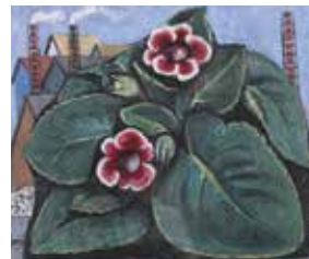
表紙 北川 民次 画 「花と瀬戸風景」