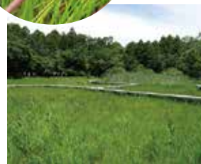
尾張旭市“ええとこ”探訪 「吉賀池湿地」