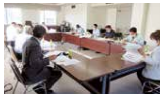
R3. 8. 3 広報委員会

令和3年8月20日 公益社団法人 瀬戸旭法人会 広報委員会 瀬戸市見付町38番地の2 TEL 0561-84-1161 FAX 0561-84-1325 http://www.setoasahi-houjinkai.org/